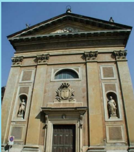
Chiesa di Santa Maria del Paradiso

Tour: Con Accompagnatore e spiegazione Storica e artistica