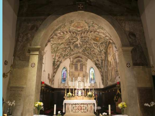
Chiesa di Santa Toscana